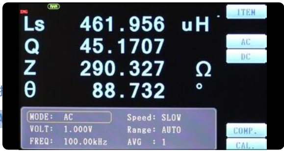
800*400 7 吋彩色螢幕，可以同時設定即顯示四種不同的參數。