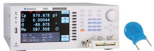
6364 測試頻率範圍從 10Hz - 100kHz，測試電容器重要參數為 Cp/D/theta/Rs。