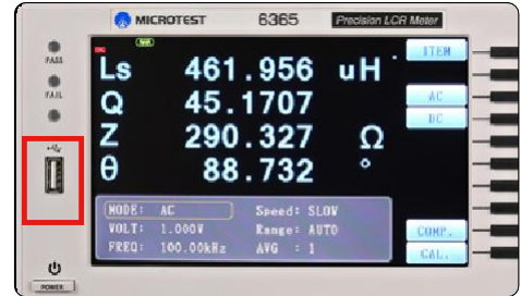
USB Host 存儲測試畫面及數據，存取的檔案數依據 USB 盤的容量大小決定。