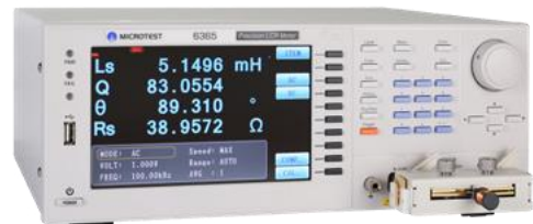
6365 測試頻率範圍從 10Hz - 200kHz，測試電感器重要參數為 Ls/Q/theta/Rs。